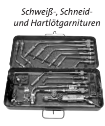
Schweiß-, Schneid- und Hartlötgarnituren