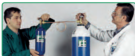
Sauerstoff selbst umfüllen im eigenen Betrieb mit dem PERKEO Umfüllbogen.

Selbst ist der Handwerker! Mit dem Hartlötgerät ECONOMY sind Sie unabhängig von Gaslieferanten. Beide Gasflaschen, sowohl die Propanflasche als auch die Sauerstoffflasche sind mithilfe eines entsprechenden Umfülladapters im eigenen Betrieb selbst wieder befüllbar. Das bedeutet Kosten- und Zeitersparnis und damit immer einen effizienten Arbeitseinsatz mit den beliebten PERKEO Geräten.